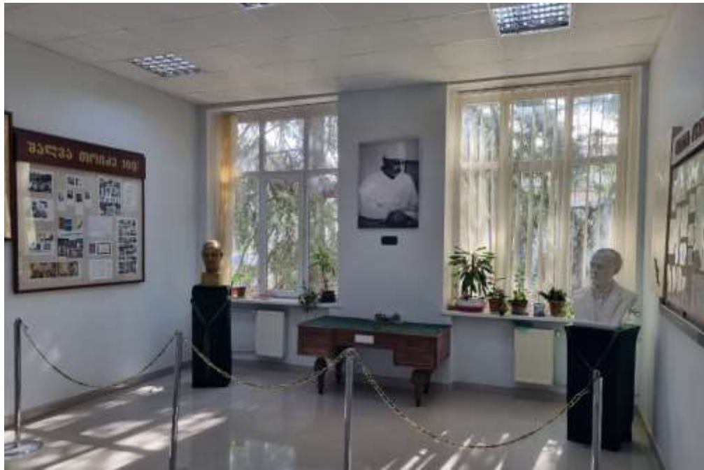
კლინიკური ანატომიისა და ოპერაციული ქირურგიის დეპარტამენტი დღეს