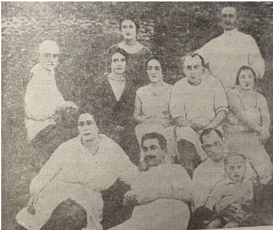
საზაფხულო არდადეგების დროს სოფ. როკითში - 1926წ.