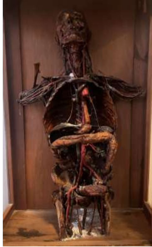
ნიკოლოზ კახიანის მიერ დამზადებული მშრალი პრეპარატები - ინახება თბილისის სახელმწიფო უნივერსიტეტის კლინიკური ანატომიისა და ოპერაციული ქირურგიის დეპარტამენტში