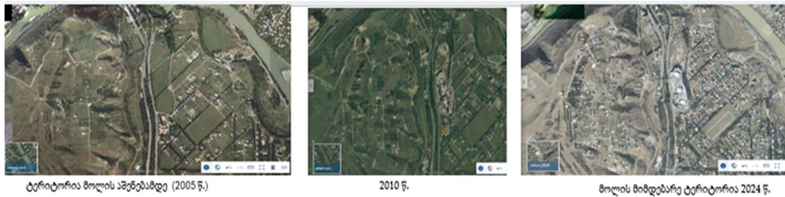
სურ. 5 ქალაქის პერიფერიული ზონის განვითარება წლების მიხედვით

ტიპოლოგიური ტერმინი - „ მოლი “ (რაც გულისხმობს: მთლიანად დახურულ შენობას, დერეფნულ გეგმარებას, ატრიუმს, კლიმატ კონტროლს და ა.შ.) ყველაზე მეტად, ჩამონათვალში თავისი მასშტაბურობით გამორჩეულ „ თბილისი მოლს “ („Tbilisi Mall“) შეეფერება. ის საქართველოში პირველი თანამედროვე სავაჭრო ცენტრია, რომელიც 2012 წელს გაიხსნა და უდიდესი გავლენა მოახდინა დედაქალაქის ურბანულ განვითარებაზე. საქართველოში მანამდე არ არსებული, ახალი ტიპის სავაჭრო-გასართობი სივრცის ქალაქის ჩრდილო-დასავლეთ ნაწილში (დავით აღმაშენებლის გზატკეცილი) განთავსება სტრატეგიული გადაწყვეტილება იყო, რასაც მოჰყვა ქალაქის პერიფერიული ზონის განვითარება (სურ. 5).