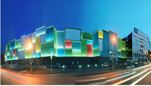
სურ. 6 „თბილისი მოლი“

გალერეები ატრიუმის ირგვლივაა განლაგებული. ვერტიკალურად გახსნილი სივრცეები კი მაქსიმალური ხილვადობის საშუალებას იძლევა.