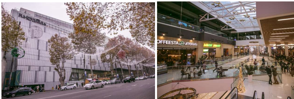
სურ. 10 „გალერია თბილისი“

კლასიფიკაციის მიხედვით სხვა კატეგორიაში ხვდება „გალერია თბილისი“. „თბილისი მოლის“ და „ისთ ფონთისგან“ განსხვავებით ეს მრავალფუნქციური სავაჭრო ცენტრი მდებარეობს დედაქალაქის გულში, რუსთაველის გამზირზე, ქალაქის ისტორიულ და ადმინისტრაციულ ცენტრში (სურ. 10). „გალერია თბილისი“ აშენდა 2017 წელს ყოფილი უნივერსიტეტის შენობის ადგილზე და თბილისის ერთ-ერთ ყველაზე პოპულარულ და ხალხმრავალ სავაჭრო ცენტრად იქცა, რაც მხოლოდ მისი ადგილმდებარეობის მხრივ მომგებიანი პოზიციის გამო არ მომხდარა. ადგილმდებარეობასთან ერთად ხალხს იზიდავს: ფუნქციური მრავალფეროვნება, პრესტიჟი, პრემიუმ ბრენდები, პრემიუმ კვების ობიექტები, აქ გამართული წარმოდგენები და ღონისძიებები. შენობაში მდებარეობს „თავისუფალი თეატრი“, „ალ. გრიბოედოვის სახელობის სახელმწიფო დრამატული თეატრი“, კინოთეატრი „კავია“, ბოულინგის დარბაზი, საბავშვო გასართობი ცენტრი, სასტუმრო, სუპერმარკეტი, ავტოსადგომი, ასევე შენობაში ინტეგრირებულია მეტროსადგური „თავისუფლების მოედანი“, რაც ზრდის ხალხის მოძრაობის ინტენსიობას. „გალერია თბილისი“ ფოკუსირებულია ტურისტებზე და ბიზნეს სეგმენტზე.