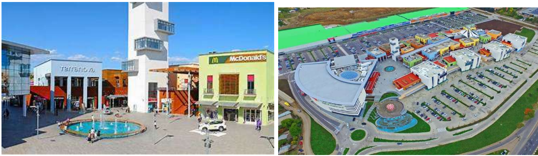
სურ. 9 მრავალფუნქციური სავაჭრო ცენტრი „ისთ ფონთი“

კლასიფიკაციის მიხედვით სხვა კატეგორიაში ხვდება „გალერია თბილისი“. „თბილისი მოლის“ და „ისთ ფონთისგან“ განსხვავებით ეს მრავალფუნქციური სავაჭრო ცენტრი მდებარეობს დედაქალაქის გულში, რუსთაველის გამზირზე, ქალაქის ისტორიულ და ადმინისტრაციულ ცენტრში (სურ. 10). „გალერია თბილისი“ აშენდა 2017 წელს ყოფილი უნივერსიტეტის შენობის ადგილზე და თბილისის ერთ-ერთ ყველაზე პოპულარულ და ხალხმრავალ სავაჭრო ცენტრად იქცა, რაც მხოლოდ მისი ადგილმდებარეობის მხრივ მომგებიანი პოზიციის გამო არ მომხდარა. ადგილმდებარეობასთან ერთად ხალხს იზიდავს: ფუნქციური მრავალფეროვნება, პრესტიჟი, პრემიუმ ბრენდები, პრემიუმ კვების ობიექტები, აქ გამართული წარმოდგენები და ღონისძიებები. შენობაში მდებარეობს „თავისუფალი თეატრი“, „ალ. გრიბოედოვის სახელობის სახელმწიფო დრამატული თეატრი“, კინოთეატრი „კავია“, ბოულინგის დარბაზი, საბავშვო გასართობი ცენტრი, სასტუმრო, სუპერმარკეტი, ავტოსადგომი, ასევე შენობაში ინტეგრირებულია მეტროსადგური „თავისუფლების მოედანი“, რაც ზრდის ხალხის მოძრაობის ინტენსიობას. „გალერია თბილისი“ ფოკუსირებულია ტურისტებზე და ბიზნეს სეგმენტზე.