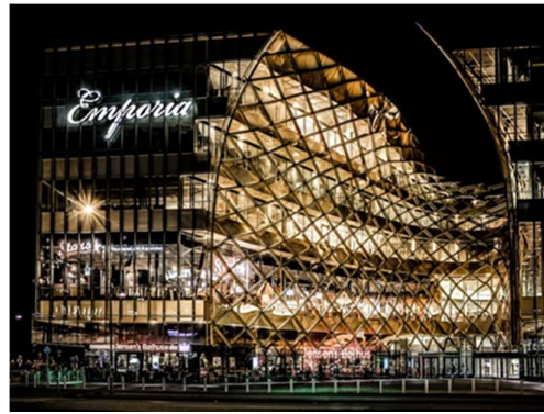
სურ. 4 სავაჭრო ცენტრი „ემფორია“, შვედეთი

მსოფლიოში ამ კუთხით მიმდინარე პროცესები საქართველოზეც აისახა. ქვეყნის მასშტაბით მოლების მშენებლობა ინტენსიურად მიმდინარეობს. განსაკუთრებული ყურადღების ღირსია ქალაქი თბილისი, სადაც ბოლო წლებში ერთმანეთისგან განსხვავებული, რამდენიმე მსხვილი მრავალფუნქციური სავაჭრო ცენტრი აშენდა. მათ შორის შეიძლება გამოიყოს სამი, ყველაზე თვალსაჩინო მაგალითი: „თბილისი მოლი“, „გალერია თბილისი“ და „ისთ ფონთი“. ცენტრები განსხვავდებიან, როგორც