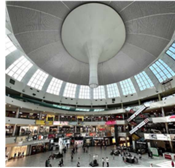
სურ. 7 „თბილისი მოლი“ - ატრიუმი

2023 წელს მოლის რენოვაციის ფარგლებში, მოხდა შიდა სივრცის განახლება. [4] ინტერიერში ნათელი ფერების შემოტანამ სივრცე ვიზუალურად გაზარდა და მეტად გამოკვეთა კვების, ბავშვთა კუთხის და კინოთეატრის ზონები, რომელიც მთლიანობაში არსებული სინათლისა და სისუფთავის ფონზე წარმოქმნის ერთგვარ ფერად ლაქებს და ქმნის სასიამოვნო, მიმზიდველ ინტიმურ სივრცეებს. [5]