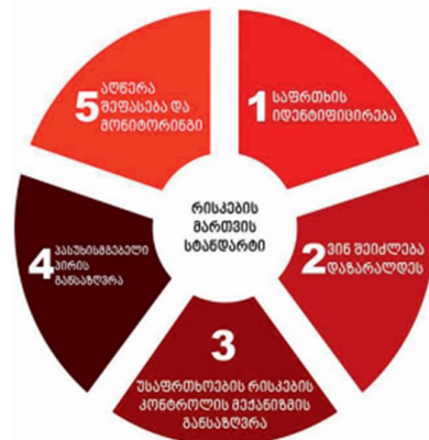
წყარო: შრომის პირობების ინსპექტირების დეპარტამენტის 2018 წლის საქმიანობის ანგარიში

2018 წელს საქართველოს პარლამენტის მიერ მიღებულ იქნა საქართველოს კანონი „შრომის უსაფრთხოების შესახებ“, რომლის საფუძველს წარმოადგენს ჩარჩო დირექტივა „სამუშაო ადგილზე მუშაკთა უსაფრთხოებისა და ჯანმრთელობის გაუმჯობესების ხელშეწყობის მიზნით ზომების შემოღების შესახებ“. თუმცა აღნიშნული კანონით შრომის ინსპექციის მანდატი გავრცელდა მხოლოდ მომეტებული საფრთხის შემცველ მძიმე, მავნე და საშიშპირობებიან სამუშაოებზე. სამსახურს თავისი გადაწყვეტილებით არ ჰქონდა უფლება ობიექტზე განეხორციელებინა არაგეგმიური ინსპექტირება სასამართლოს ნებართვის გარეშე. მას შემდეგ რაც შეიქმნა საქართველოს კანონი „შრომის უსაფრთხოების შესახებ“, დეპარტამენტის წარმომადგენლები ობიექტის მხრიდან მომართვის შემთხვევაში მცირე და საშუალო ბიზნესის წარმომადგენლებს ეხმარებოდა შრომის უსაფრთხოების სისტემის ჩამოყალიბებაში, კერძოდ კი საერთაშორისოდ აღიარებული რისკის შეფასების 5 საფეხურიანი სისტემის დანერგვაში. აღნიშნული სისტემა მოიცავს: საფრთხის იდენტიფიცირებას, დაშავებულთა სავარაუდო წრის, კონტროლის მექანიზმების, პასუხისმგებელი პირების განსაზღვრას და არსებული საფრთხის შეფასებასა და მონიტორინგს.